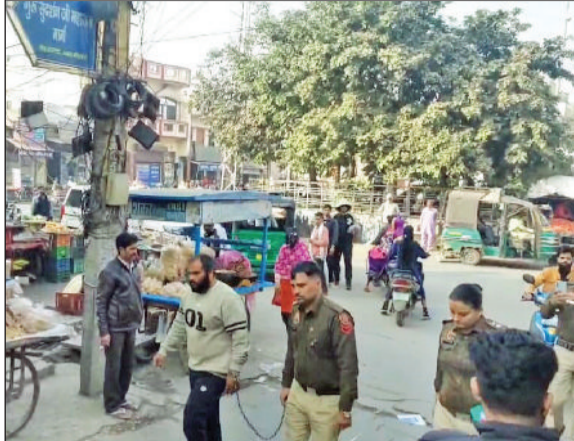
आरोपित को लेकर आते ओल्ड सब्जी मंडी पुलिस।