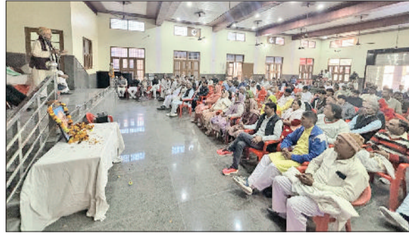
महम। मीटिंग में भाग लेते हलका महम के भाजपा कार्यकर्ता और उन्हें संबोधित करते राज्यसभा सांसद रामचंद्र जांगड़ा।

भारतीय जनता पार्टी महम विधानसभा की एक संगठनात्मक बैठक रविवार को काठमंडी स्थित वाल्मीकि धर्मशाला में हुई। बैठक को राज्यसभा सांसद रामचंद्र जांगड़ा समेत कई भाजपा नेताओं ने संबोधित किया। राज्यसभा सांसद रामचंद्र जांगड़ा ने कार्यकर्ता मीटिंग को संबोधित करते हुए कहा