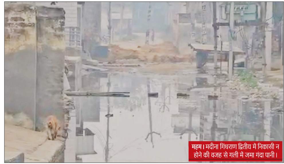
महम। मदीना गिंधराण द्वितीय में निकासी न होने की वजह से गली में जमा गंदा पानी।